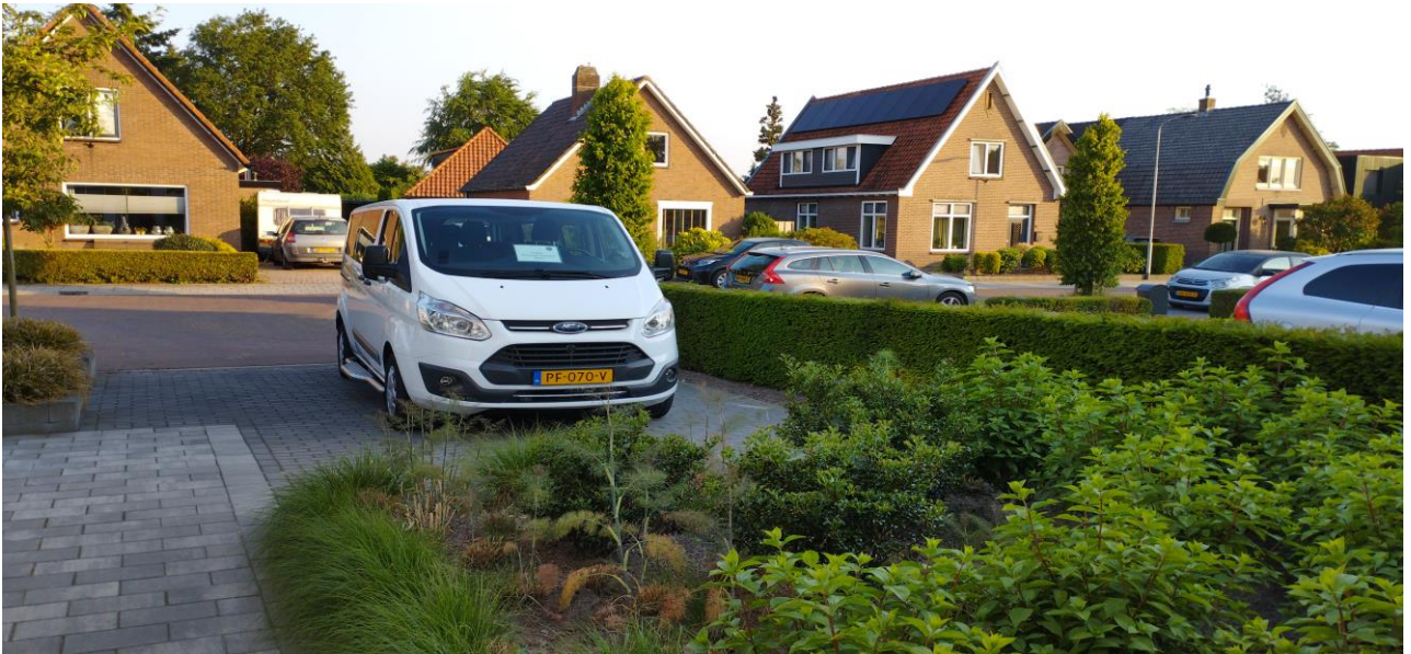
Het huis voor deze week is groot en prachtig!